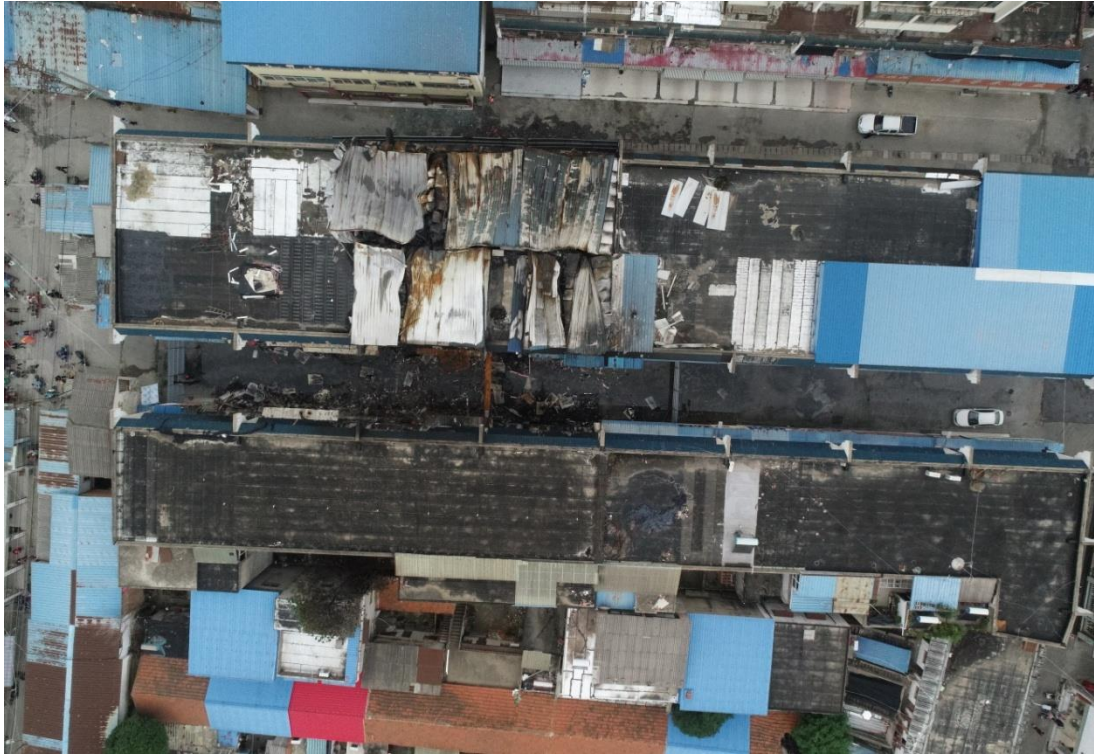
图4 护城河商业街过火区域无人机俯视照片