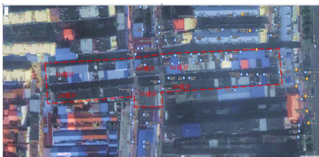
图2 护城河商业街卫星地图，过火商铺位于1#、2#楼西部